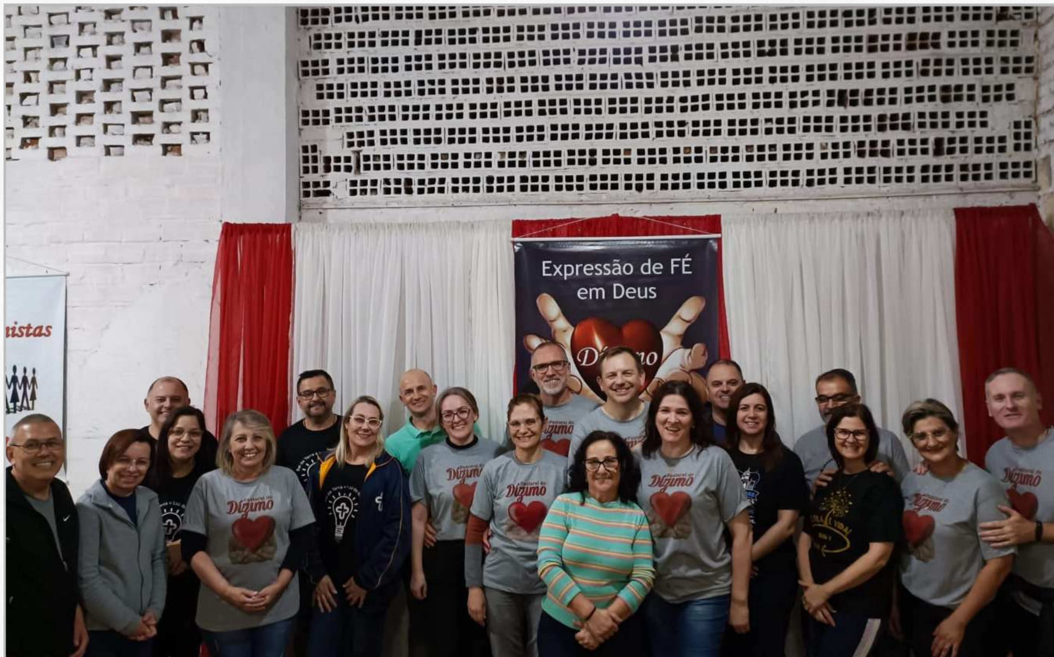
04/11 - Jantar dos Dizimista