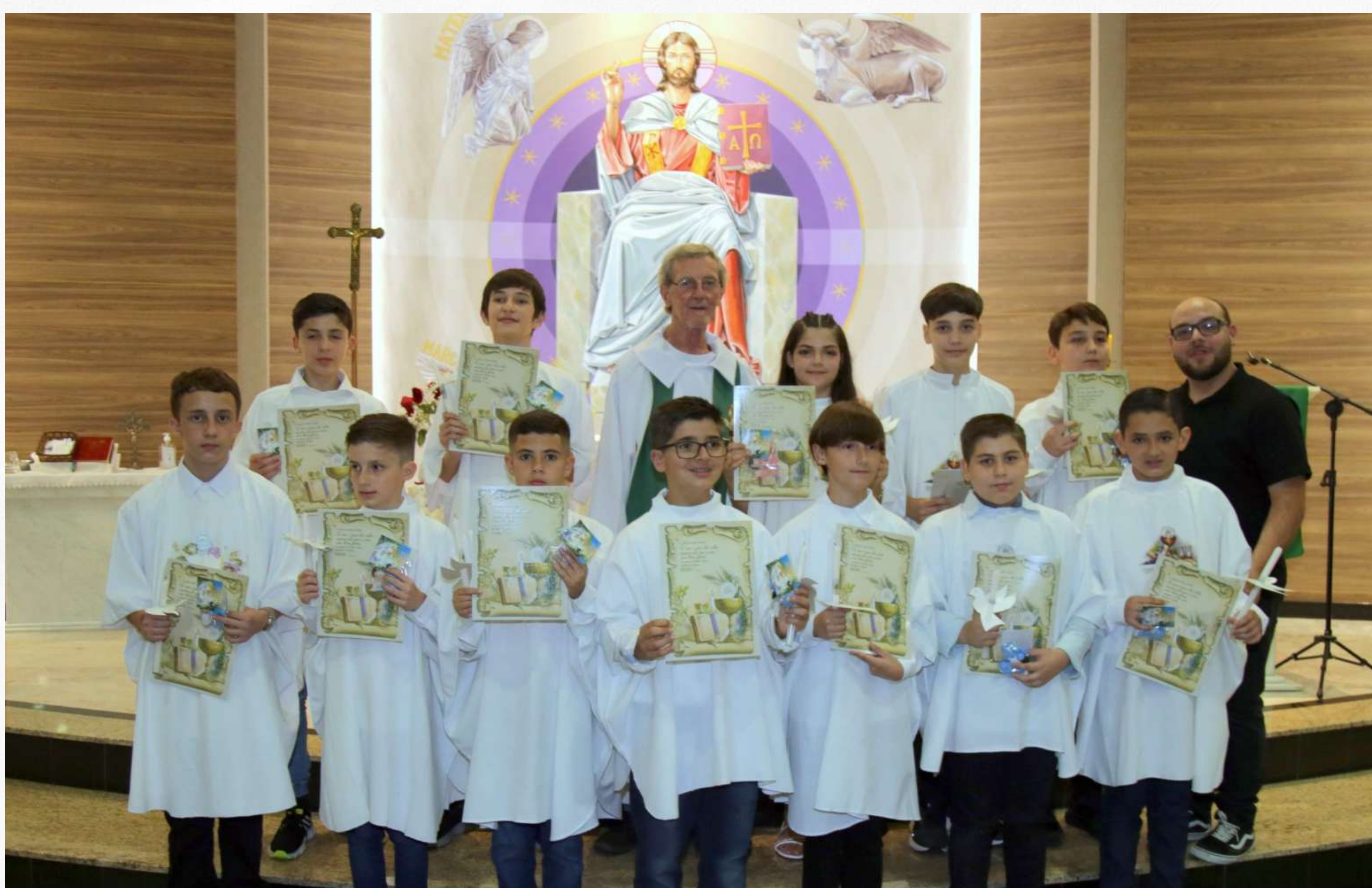
11/11 - Primeira Eucaristia na São José