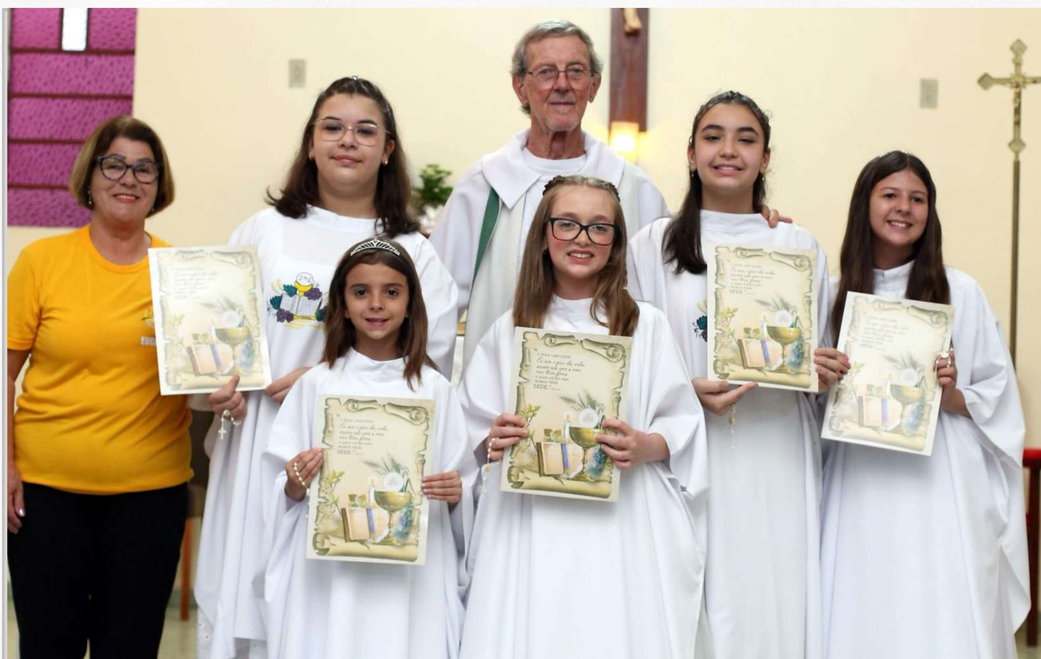
11/11 - Primeira Eucaristia na Santa Rita