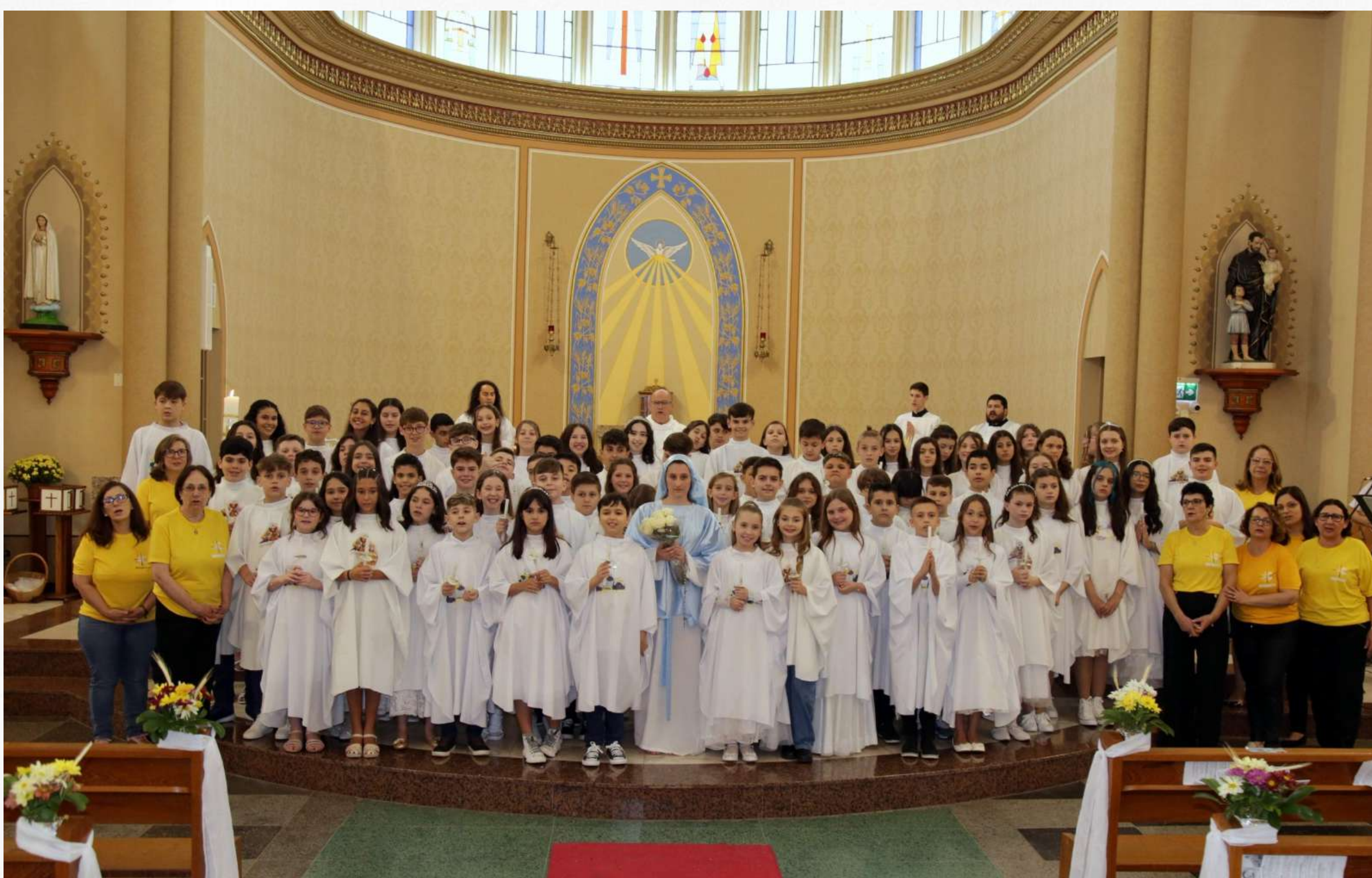
11/11 - Primeira Eucaristia na Matriz